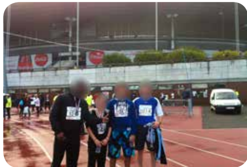
Le Marathon à Saint-Denis

-Domaine des mères adolescentes : regroupe l'AME (accueil mère-adolescentes et JMB (jeunes mamans bébés)