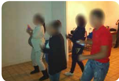
Activité Just Dance